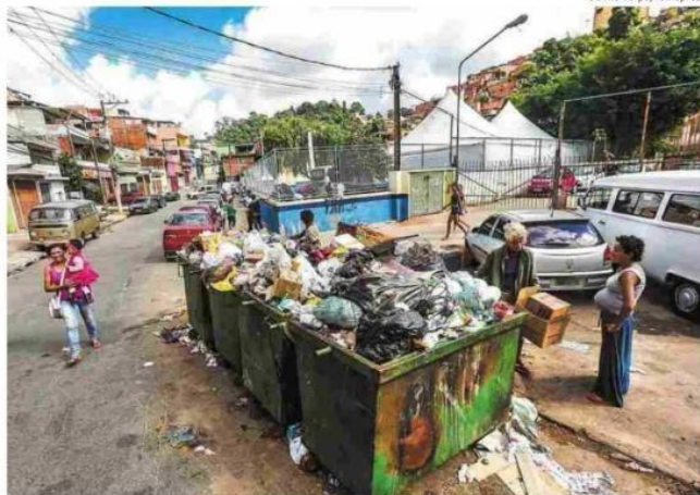
Lixo acumulado próximo a tenda para pacientes com dengue na Brasilândia (zona norte)