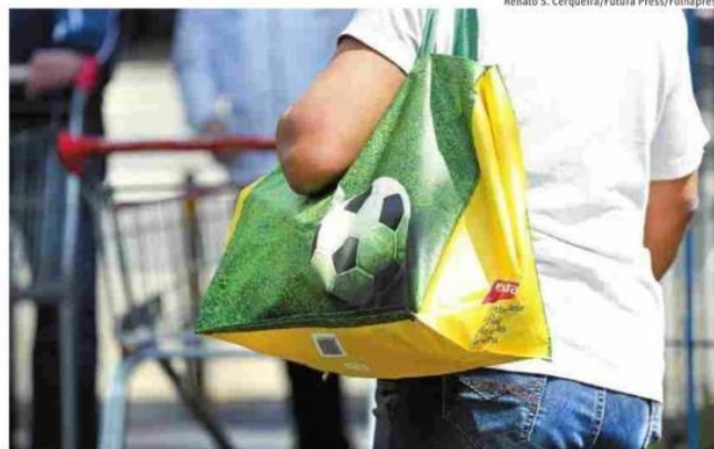
Consumidora sai de hipermercado na Bela Vista (centro de SP) com sacola retornável

“Eles não sabem nem onde comprar essa nova sacola.