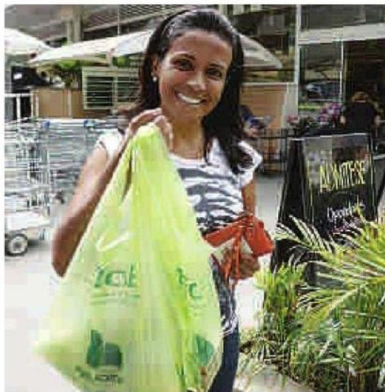
O Pão de Açúcar deu a sacola reciclável ontem, mas hoje vai passar a cobrar

O comerciante que desprezar a lei poderá receber multa de R$ 500 a R$ 2 milhões, segundo a gravidade e o impacto do dano provocado ao meio ambiente. Já o cidadão que não cumprir as regras poderá receber advertência e, se reincidente, multa entre R$ 50 e R$ 500. Ainda não está claro, mesmo com a legislação em vigor, como será feita a punição efetiva da população.