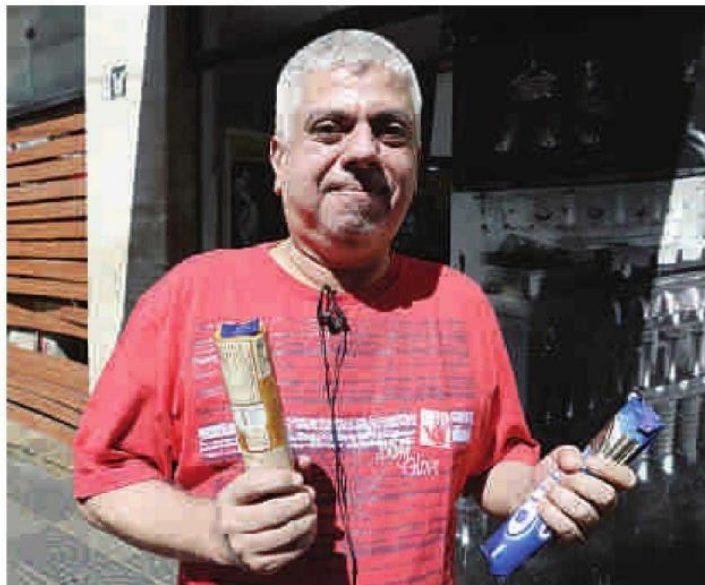
Teve gente que, ao não encontrar o utensílio em uma padaria do Centro, saiu levando os produtos na mão