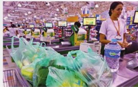
Segundo aponta a pesquisa Datafolha, 82% dizem que a gratuidade das sacolas deveria ser um direito do consumidor adquirido por lei.

O Datafolha perguntou aos paulistanos quem seria o maior beneficiado com a cobrança das sacolas plásticas. Para 54% dos entrevistados, os supermercados são os mais beneficiados. Em seguida, aparece a prefeitura 25% e o meio ambiente aparece