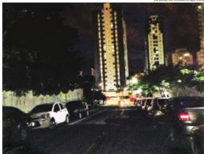
Vereador de São José do Rio Preto

A Rua Arnaldo Rosa (foto), uma pequena ligação entre as avenidas Vereador Abel Ferreira e Regente Feijó, no Jardim Anália Franco, continua sem iluminação pública. Alvo de reportagem há alguns anos desta Gazeta , um morador chegou a entrar em contato com este semanário para dizer que pedidos para instalar postes de luz já haviam sido realizados. Mas até o momento nenhuma providência foi tomada e quem precisa passar pelo local à noite só tem a iluminação secundária do hospital particular que ladeia a via, de um conjunto residencial e, agora, de outro edifício recém-construído. Com isso, a segurança de quem estaciona e anda pela Rua Arnaldo Rosa fica completamente comprometida. A zeladoria da área é de responsabilidade da Subprefeitura