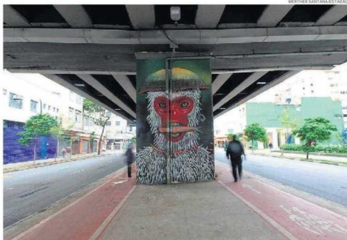
Hoje. Considerada área abandonada, a parte de baixo recebeu ciclovias neste ano