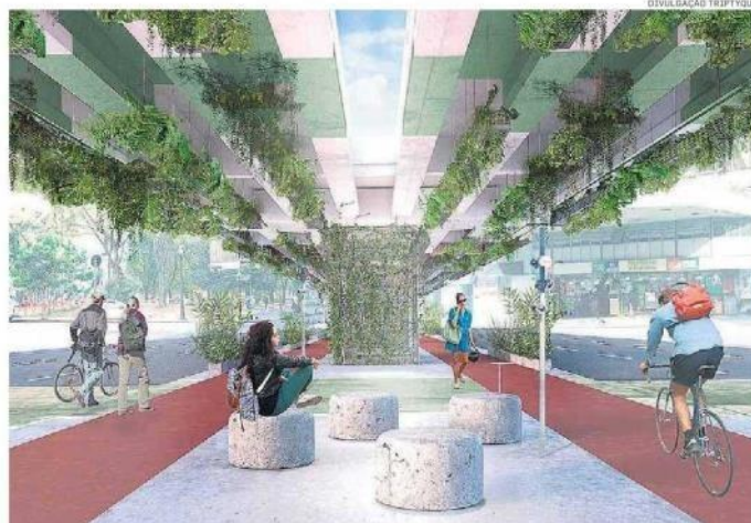
Futuro. Projeção de como ficará o espaço, com abertura para o sol, banquinhos e plantas