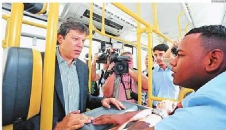
A prefeitura criará um Centro de Controle Operacional (CCO) para monitorar o andamento das linhas

"O que pensa o TCM sobre editais?", disse ironicamente.