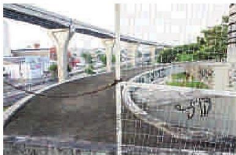
Apenas uma corrente "impede" a passagem ao local indevido