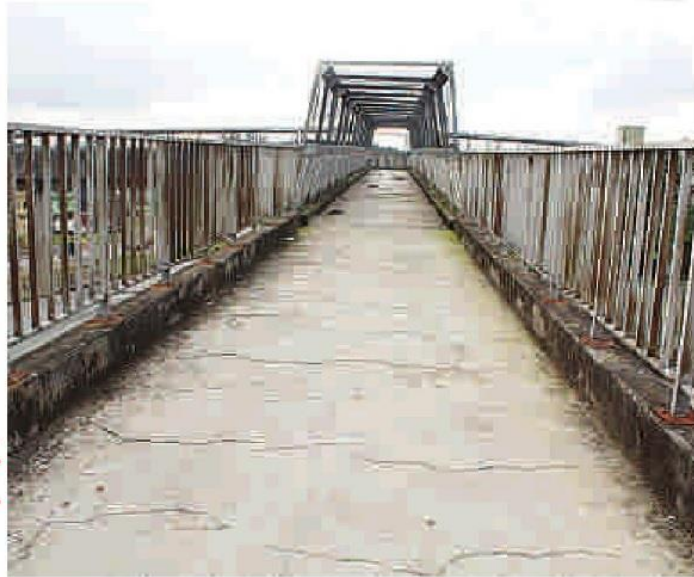
Gradil da passarela na Jacu-Pêssego está toda enferrujada e solta: perigo real para que passa por ali