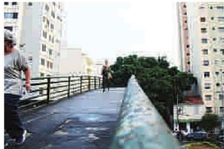
Pavimento da Ítalo Pataioli está todo rachado e faltando pedaços