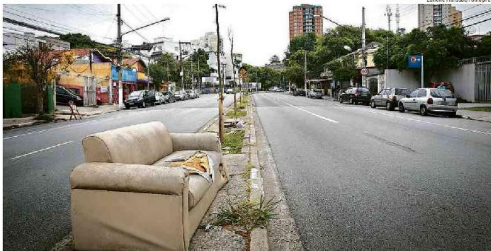
Sofá no canteiro central de avenida no Butantã (zona oeste de SP); prefeito eleito promete reforçar ações de zeladoria

A promessa esbarra no fato de que a prefeitura terá menos dinheiro para custeio, já que o orçamento estimado para 2017 não prevê reposi-