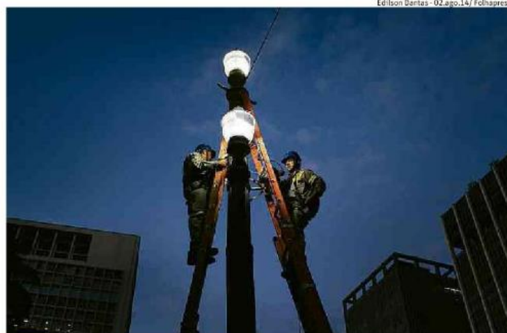
Prefeitura instala lâmpadas de LED no viaduto do Chá, região central de São Paulo

A votação ocorreu em meio a impasse judicial, que se arrastava desde o dia 2 de outubro, data da eleição municipal. Na ocasião, a Justiça decidiu que o TCM não tinha autoridade para impedir a licitação, o que havia sido feito pelo órgão após ser acionado por um dos concorrentes, o consórcio FM Rodrigues/CLD. O grupo recorreu ao Tribunal de Justiça e conseguiu reverter a decisão onze dias depois, devolvendo ao TCM a competência pela decisão.