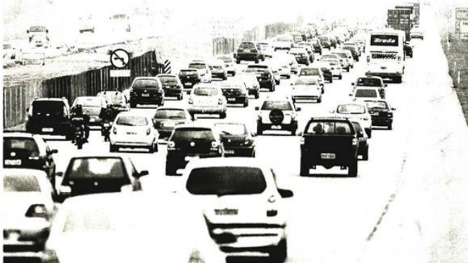
■ Rodovia dos Imigrantes tem lentidão na altura do km 32, no sentido litoral, por volta das 19h de ontem; congestionamento foi do km 28 ao km 43