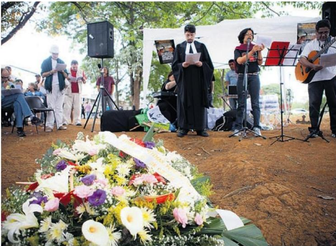
Ato ecumênico no Cemitério da Vila Formosa em memória aos desaparecidos e mortos pela violência durante a ditadura e nos dias de hoje