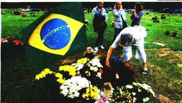
■ Visitantes prestam homenagem no túmulo do piloto Ayrton Senna, morto em 1994; sepultura de ídolo era a mais visitada no Cemitério do Morumbi

"Senna é uma inspiração para mim, é o maior brasileiro de todos os tempos. Nunca mais vai existir um piloto e um herói brasileiro como ele." (trq)