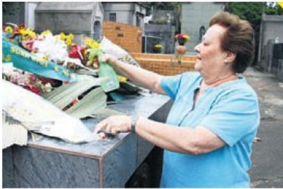
Mulher observa lápide no Cemitério Vila Nova Cachoeirinha, na Zona Norte, que teve grande movimentação