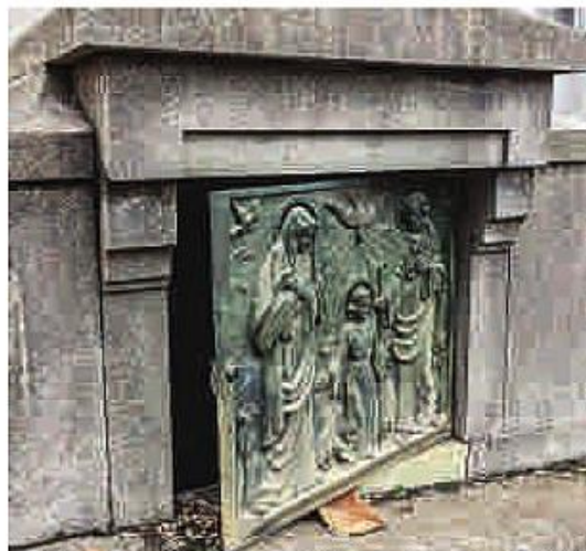
Porta arrombada foi deixada entreaberta após violação das gavetas

Em um dos túmulos do Cemitério Vila Mariana ação dos criminosos fica clara. Eles quebram as paredes das gavetas de túmulos para tentar furtar joias dos mortos