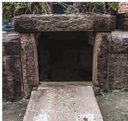
Nesse túmulo, os bandidos deixaram a porta derrubada no chão