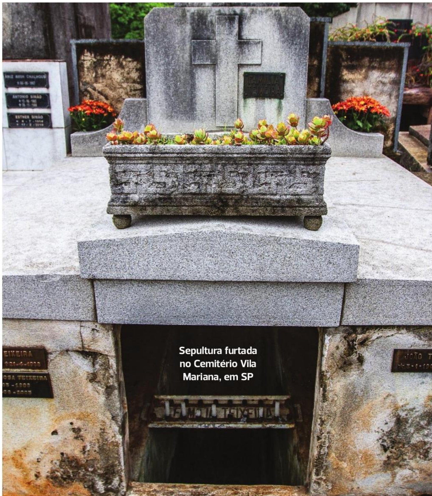
Sepultura furtada no Cemitério Vila Mariana, em SP

Sepulturas são violadas e cadáveres têm pertences furtados em cemitérios da cidade. No da Vila Mariana, levam alianças, relógios e até dentes de ouro P2 e P3