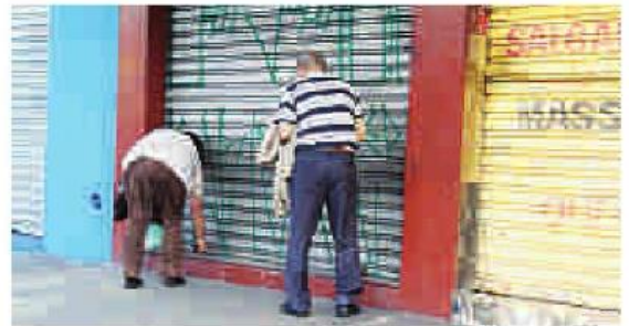
Comerciantes fecham antes de anoitecer com medo de roubos