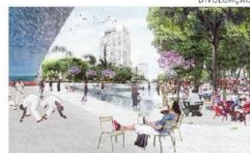
Prefeitura quer urbanizar o centro

Um dos projetos visa a construção de um grande espelho d’água no centro do Anhangabaú.