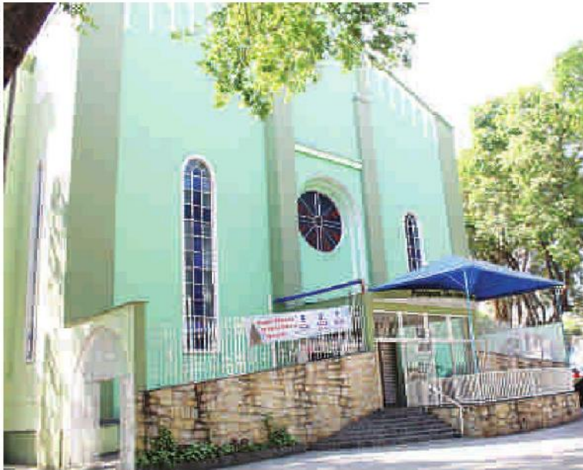
Fielés têm medo de ir à missa por causa dos furtos que acontecem no Largo de São José do Maranhão