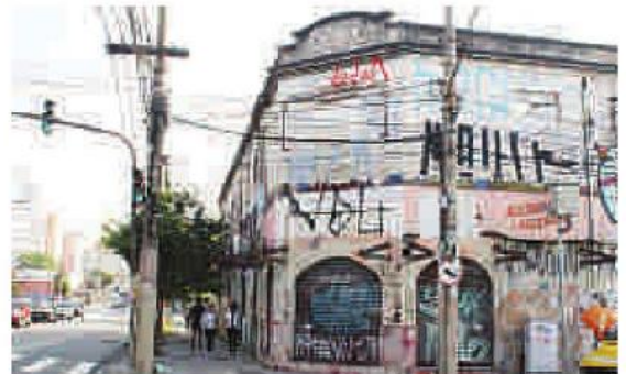
Prédio invadido por viciados na esquina da Avenida Celso Garcia