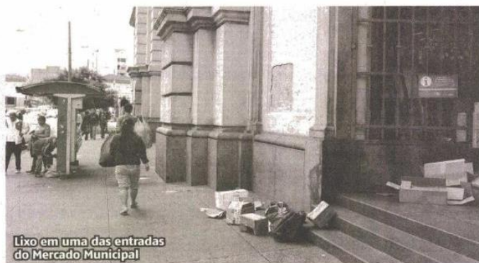
Lixo em uma das entradas do Mercado Municipal