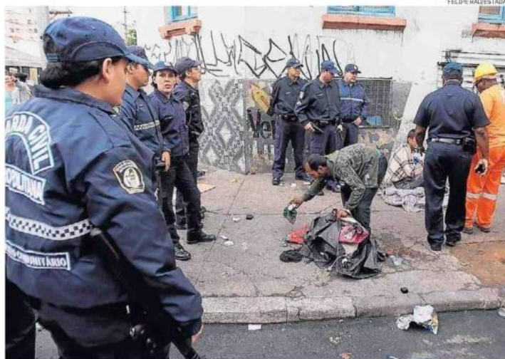
Fim da 'favelinha'. Funcionários da Prefeitura e GCMs fizeram limpeza ontem na região

"É um padrão muito parecido com o melhor momento do programa De Braços Abertos, em