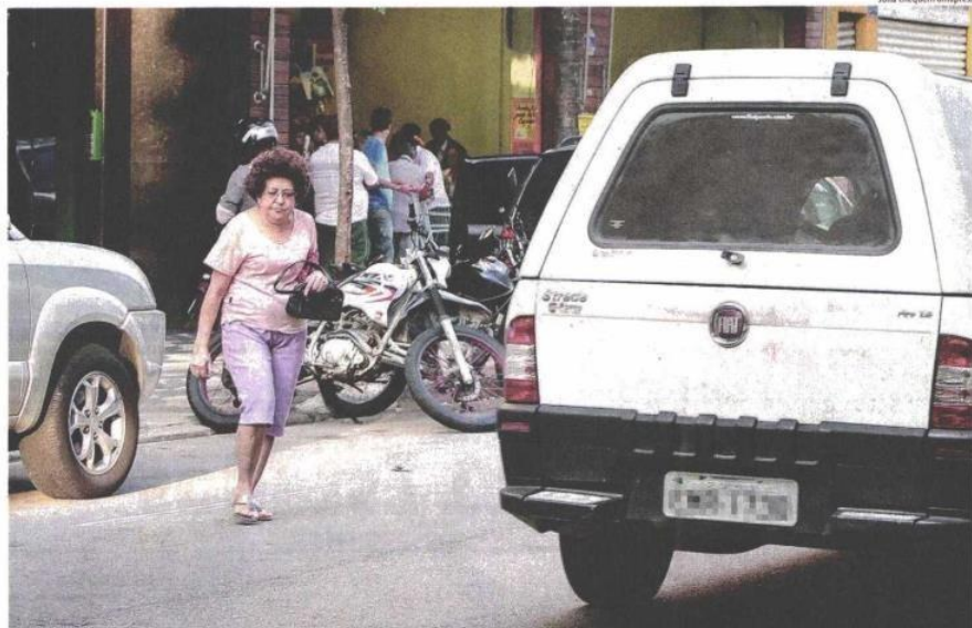
Idosa atravessa a rua das Palmeiras, em Santa Cecília (região central de São Paulo); levantamento da CET mostra que em 2014, 122 das 140 mortes de aposentados ou pensionistas aconteceram em atropelamentos

No ano passado, 140 aposentados ou pensionistas morreram na capital, a maioria atropelada