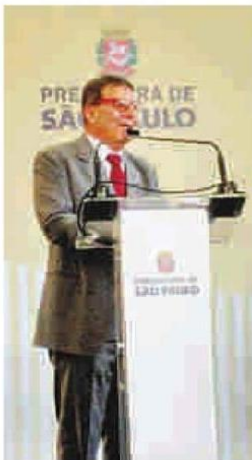
Nabil Bonduki discursa durante a posse

Segundo o novo secretário, os desfiles das escolas no Anhembi e as comemorações de rua não influenciarão no consumo de água. “O Anhembi tem um sistema próprio de abastecimento, que não vai exigir um consumo extra da Sabesp. Já as ruas serão limpas com água de reúso ”, defendeu. O discurso vai ao encontro do apresentado por Nabil antes mesmo de ele assumir o cargo, em uma coletiva na Prefeitura na semana passada. “A Grande São Paulo tem 20 milhões de habitantes que tomam banho, usam banheiro, estão usando os recursos. Não é o Carnaval que vai aumentar esse consumo”, disse.