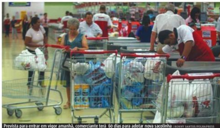
Prevista para entrar em vigor amanhã, comerciante terá 60 dias para adotar nova sacolinha

Com a decisão de última hora, comerciantes e con-