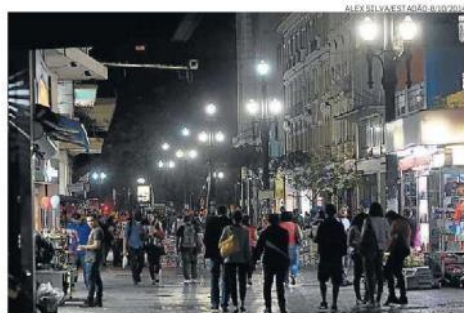
Luz. Presidente de tribunal seguiu voto do relator do caso

A AES Eletropaulo e a Prefeitura de São Paulo informaram que ainda não foram notificadas oficialmente da decisão, tomada durante sessão ocorrida na quarta-feira. A Prefeitura ressaltou, ainda, que vai acatar todas as recomendações do tribu-