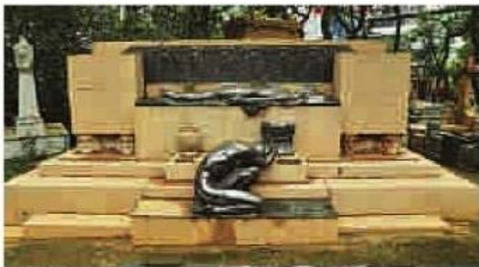
Neilson Cordeiro/Diário SP