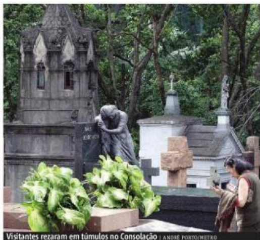
Visitantes rezaram em túmulos no Consolação

Uma faixa alertava os visitantes para tomarem cuidado com pontos onde a água poderia ficar parada, como pratos de vasos e sacos plásticos, favorecendo o aparecimento do mosquito