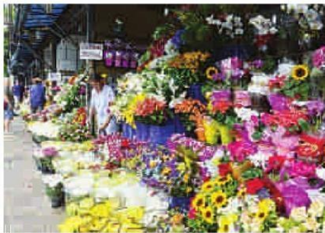
Banca de Flores no Cemitério do Araçá prevê vendas 30% menores