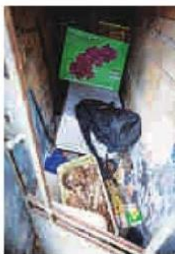
Ossos expostos no Araçá