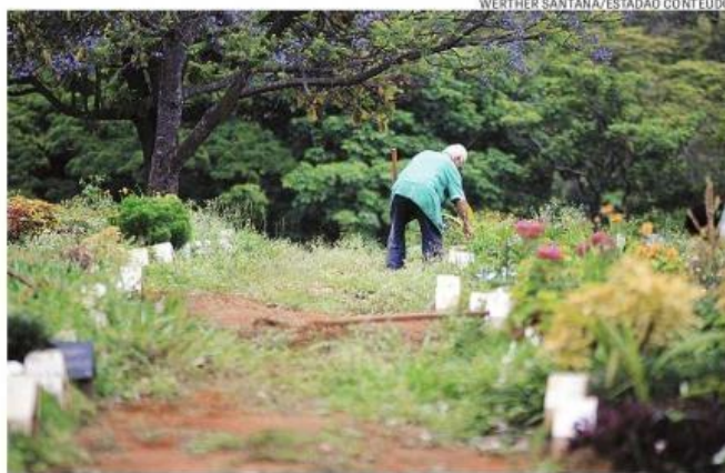
Funcionários limpam o Cemitério da Vila Formosa, na zona leste

Para o trânsito, a Companhia de Engenharia de Tráfego (CET) montará um esquema especial