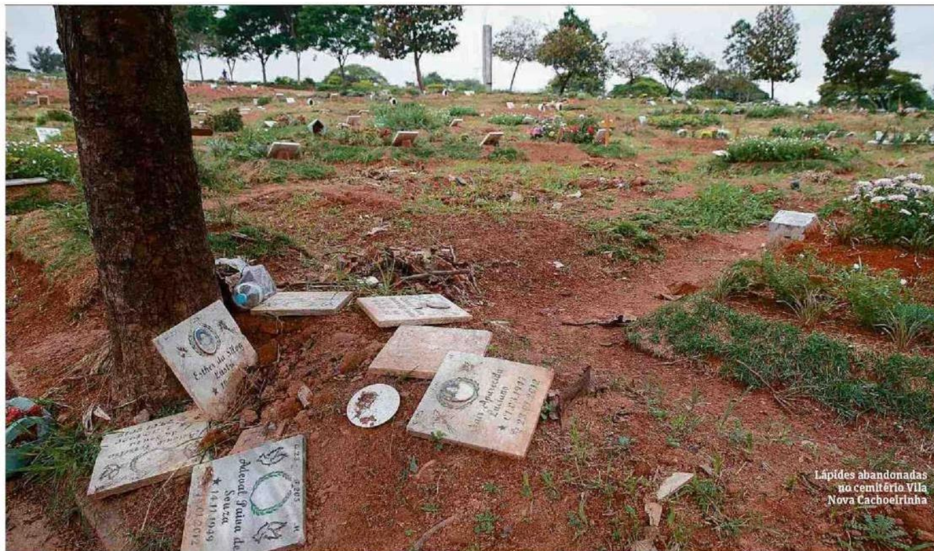
Lápides abandonados no cemitério Vila Nova Cachoeirinha