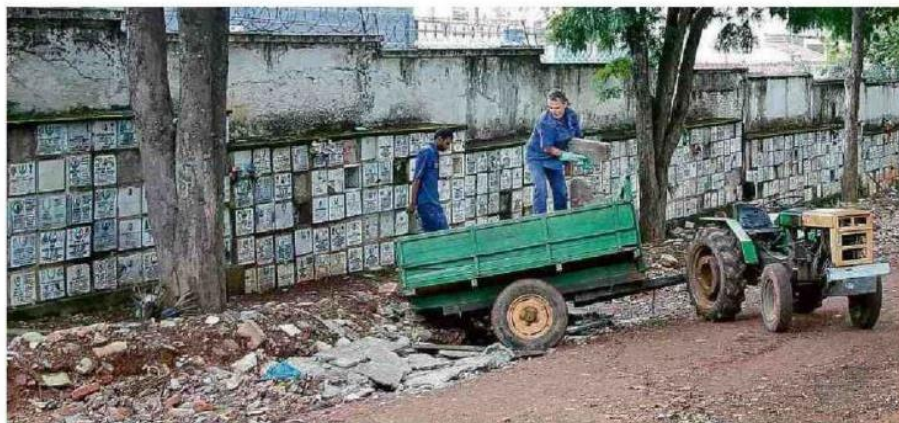
Funcionários jogam entulho e placas de cimento no Cemitério da Saudade, em São Miguel Paulista, na zona leste de SP

porque moradores de rua que dormem no cemitério limpam alguns túmulos e áreas comuns, em troca de doações.