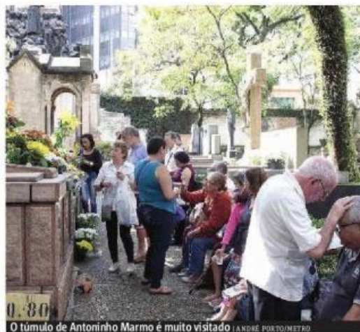
O túmulo de Antoninho Marmo é muito visitado