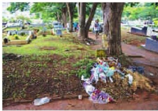
Lixo nas ruas da necrópole Vila Nova Cachoeirinha, na Zona Norte