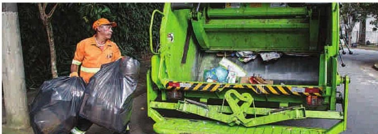
Caminhões da coleta seletiva atendem 84 distritos da capital paulista. Só no primeiro semestre deste ano foram 40,8 mil toneladas de lixo reciclável recolhidos na cidade de São Paulo