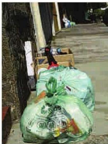
Rua na Lapa fica sempre cheia de sacolas verdes

Até 2016, segundo Pais, a meta é incluir todos os 96 distritos da cidade na coleta seletiva. Hoje, 157 caminhões recolhem o lixo de 84 bairros. Além disso, dois centros de triagem devem ser inaugurados no próximo ano.