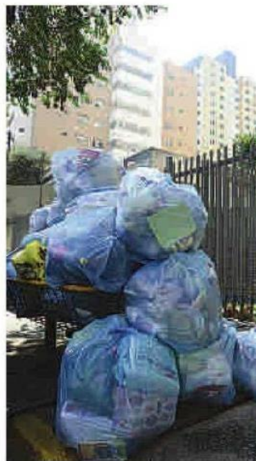
Prédio organizou e colocou uma sacola dentro da outra