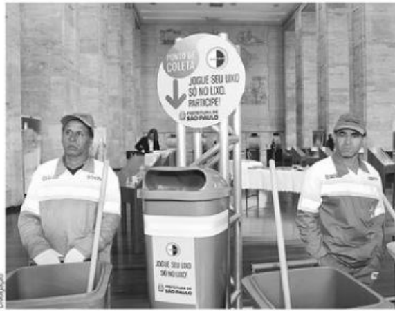
Mais de 4.200 pessoas vão trabalhar na limpeza, 27% a mais que em 2011

A novidade deste ano fica a cargo das "varredoras mecânicas", que agilizarão a limpeza de calçadas e outras vias, fazendo os serviços de varrição e lavagem ao mesmo tempo. Segundo o prefeito, serão seis no total, das quais três de pequeno porte para o uso em passios e calçadas, além de outras duas varredoras grandes e uma média para o uso no leito carroçável das vias. "A nossa expectativa é que na segunda-feira [7] a cidade esteja totalmente liberada, com os trabalhos concluídos. A partir de sexta-feira, na véspera da Virada Cultural, já teremos equipes extras de limpeza atuando para que as áreas das