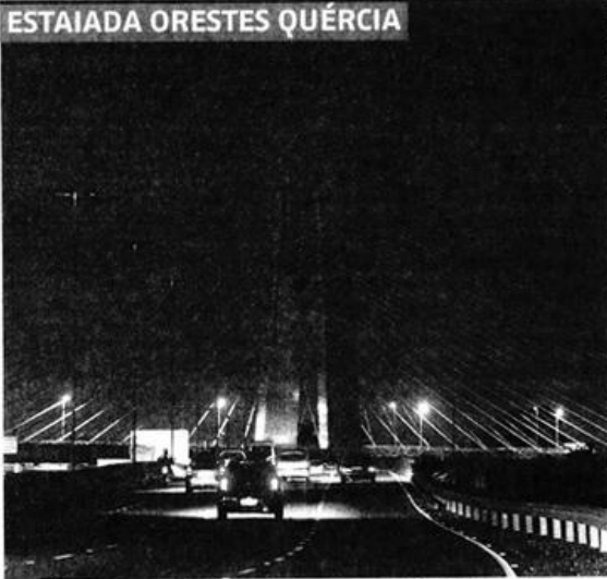
■ Veículos transitam pela ponte estaiada Orestes Quêrcia, sem iluminação, na noite de ontem