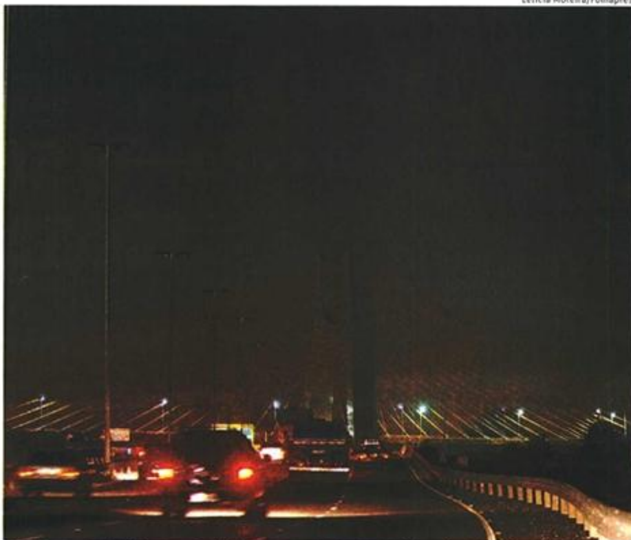
Ponte governador Orestes Quércia, na zona norte, apagada após roubo de cabos de metal