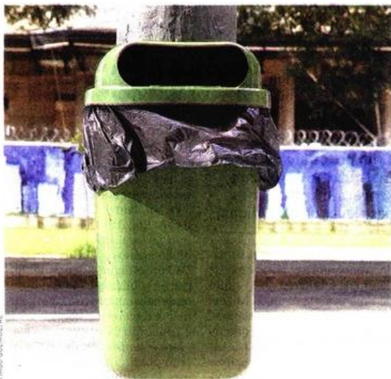
Lixeira na Avenida Francisco Matarazzo: uma a cada 50 metros