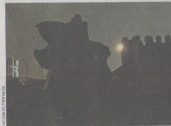
Monumento às Bandeiras, na zona sul: adesão à 5ª Hora do Planeta

Participaram desta edição países como Paraguai, Austrália, Polônia, Itália, Alemanha, Espanha e Rússia. ::