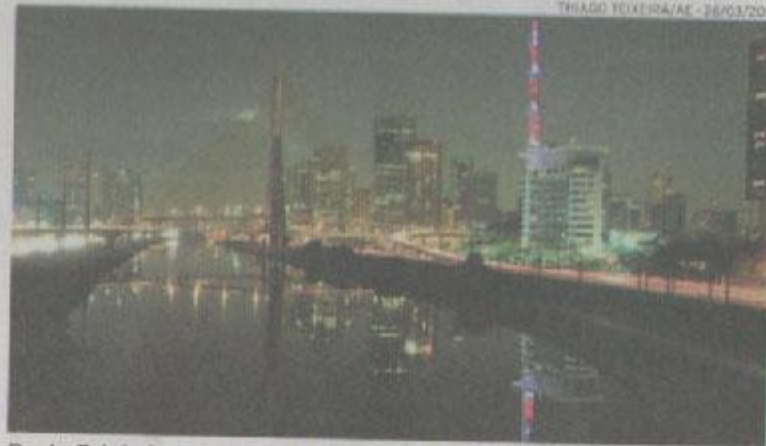
Ponte Estaiada, na zona sul, ficou apagada por uma hora na ação de 2011

Agora em 2012, estão confirmadas a participação dos paulista-