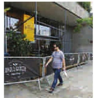
Grades para evitar xixi em local incorreto