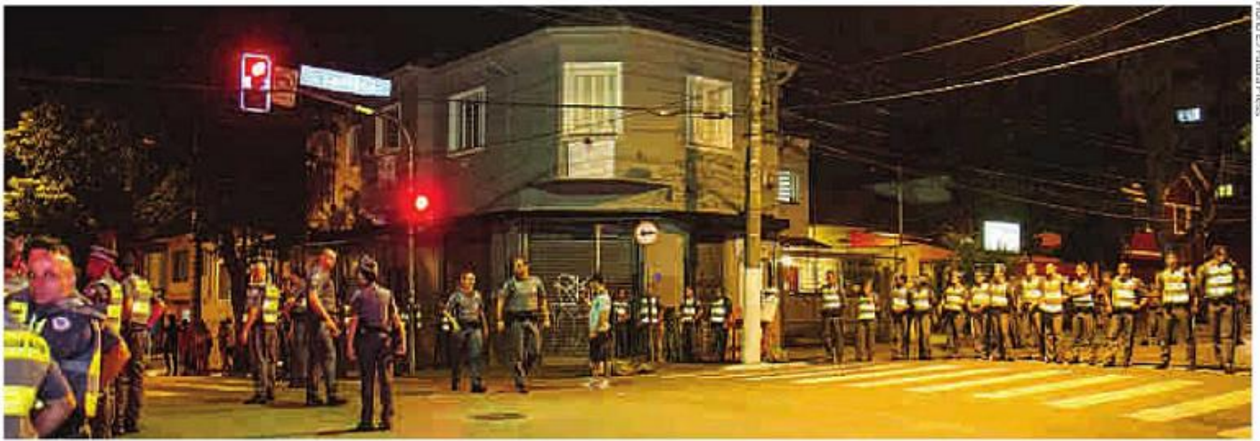
Policiais militares fazem cordões de isolamento a partir das 0h para esvaziar a Zona de Atenção Especial, que permite a entrada de até 15 mil foliões por dia, na Vila Madalena