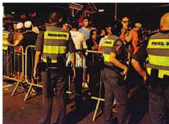
Depois dos foliões saírem, na madrugada de domingo, ninguém pôde voltar

No próximo fim de semana essa tática será repetida, com os PMs formando cordões de isolamento e "empurrando" os foliões à Rua Inácio Pereira da Rocha, a caminho das estações de Metrô Vila Madalena e Fradique Coutinho.