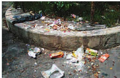
Restos de comida acabam jogados ao longo da extensão do elevado