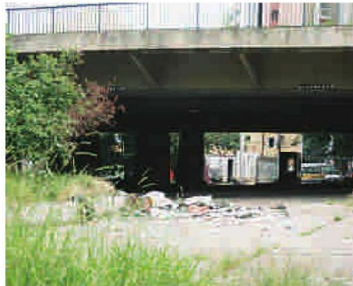
Mato e o lixo se acumulam embaixo do viaduto Júlio de Mesquita Filho