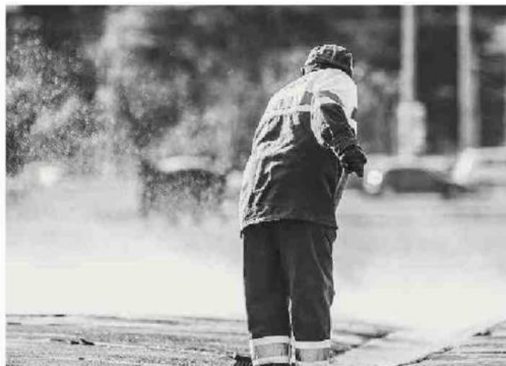
Objetivo é valorizar a profissão com relatos