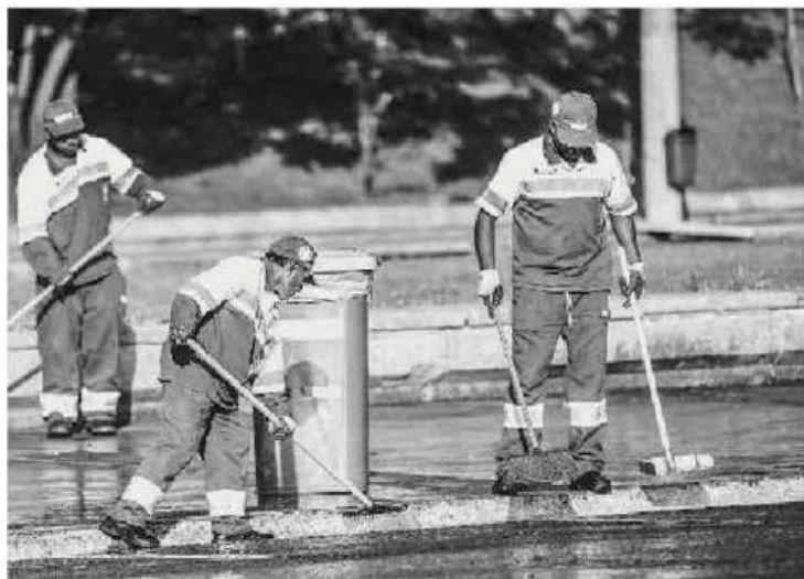
Livro com histórias de garis da capital foi lançado na Bienal