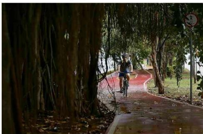
Ciclista pedala em trecho pouco iluminado na ciclovia da avenida Sumaré, na zona oeste