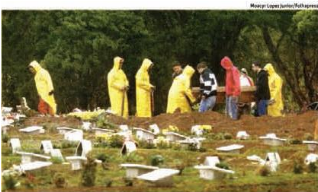
» NA CHUVA Funcionários terceirizados de limpeza fazem sepultamento no cemitério da Vila Formosa, em SP; greve no serviço funerário atrasou dezenas de enterros Cotidiano C4