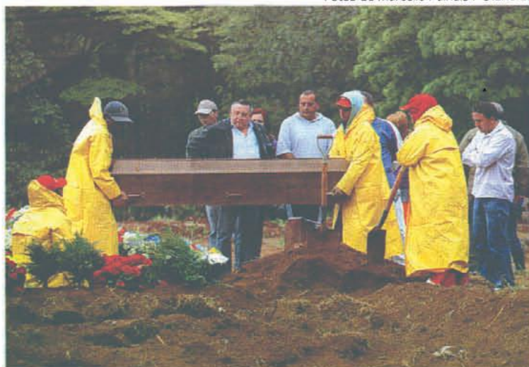
Com capas amarelas para se proteger da chuva, jardineiros viraram coveiros no Cemitério Vila Formosa