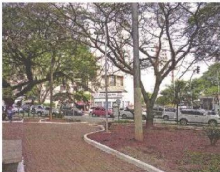
Praça Santa Rita ganhou 15 postes para auxiliar na iluminação

Incrementados pela nova iluminação, agora os jardins e árvores da praça Santa Rita, seus vários equipamentos de ginástica, ATI – Academia da Terceira Idade, e o sinal de internet gratuito, disponibilizado pelo programa WiFi livre da Prefeitura de São Paulo, poderão ser mais aproveitados. “Antes eu tinha medo de ficar na praça. Começa a cair a noite eu até evitava passar pelo local. Mas agora vamos ficar no espaço