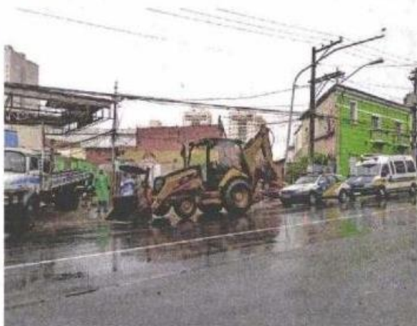
Desocupação teve continuação na manhã de segunda-feira (15)

A luz e a água do terreno já foram desligadas. O espaço é particular, então a Prefeitura vai limpar o terreno, retirar os entulhos e levantar um muro. As despesas devem ser incluídas no Imposto Predial e Territorial Urbano (IPTU) do proprietário. "Vamos manter o congelamento da área para que não haja novas invasões", afirmou Nappi.