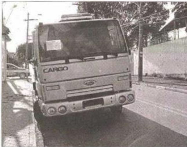
Caminhão estacionado na rua Marcelo Muller

“Estão ocorrendo assaltos frequentes na rua Inácio com a rua Fabiano Alves, na Vila Zelina. Acontecem na parte da manhã, antes das 7h, e a tarde, depois das 17h. Além dessas ruas, as vias paralelas à avenida Anhaia Mello, nas proximidades da estação do metrô, também são alvos dos criminosos. São grupos de meninos armados, aparentemente menores de idade. Na última segunda-feira, dia 8, ocorreram dois assaltos. Em um deles um grupo de jovens que frequenta uma paróquia da região foi roubado. A pra-