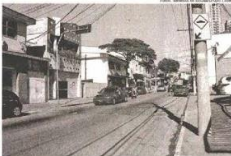
Lombada com a pintura apagada na Rua Nova Jerusalém, 1.114

Já na Rua Cantagalo o problema é com relação à pintura de sinalização de solo que separa as duas mãos. Ela simplesmente