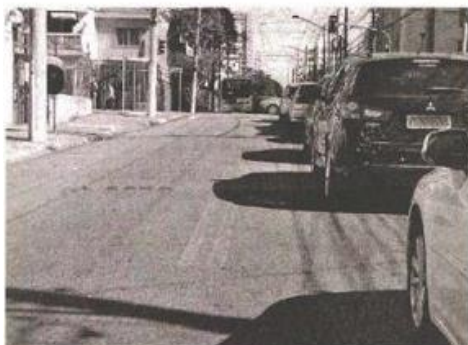
Muito pouco dá para se ver da faixa contínua pintada na Rua Cantagalo

sumiu no trecho que compreende as ruas Antonio de Barros e Francisco Marengo. No local, a equipe desta Gazeta constatou a sua existência e fez a seguinte pergunta: o que será que pode ter acontecido para a pintura, naquele local, simplesmente ter apagado e não suportado a ação do tempo tão rapidamente?