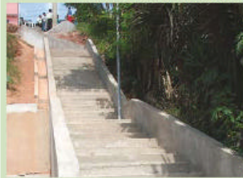
Fim do sufoco: a vielas que liga as ruas Langames e Golpazzari

Q uero mora em Campo Limpo sabe como as vielas são importantes. A geografia do bairro é muito acidentada. Em fevereiro, mais três foram entregues. Uma liga as ruas Fim de Primavera e Márcio Akira Miura, na Vila Prel. Outra está na praça João Paes Mello, no Parque Regina – esta ganhou até iluminação. E a terceira liga as ruas Langames e Golpazzari, no Capão Redondo. Até o fim do primeiro semestre serão feitas outras 15 vielas.