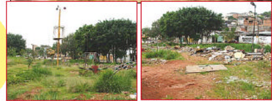
Quem te viu, quem te vê: muito e entulho (foto: menor) não fazem mais parte da paisagem da praça

10 praças foram reformadas desde 2005, totalizando 28.300 m² de área