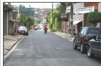
Rua Perebeiras: pedido de 20 anos atendido

3.560 crianças passaram pela piscina do Balneário Sinésio Rocha no mês de janeiro