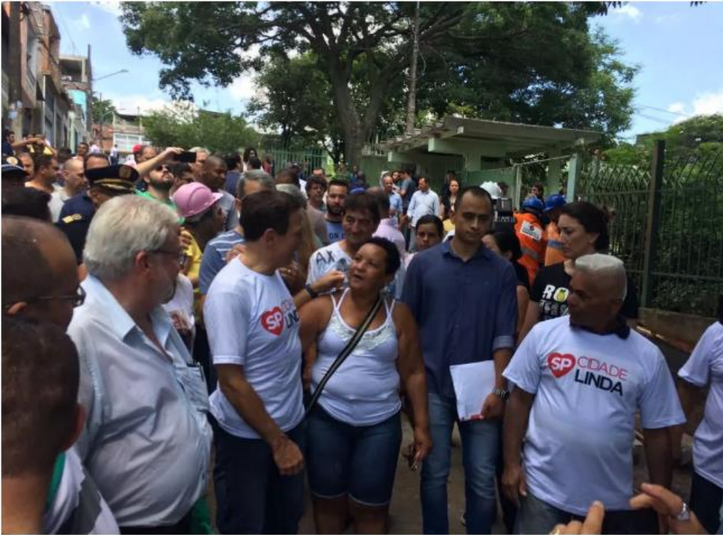
Doria participa de mutirão para o Calçada Nova

Ao lançar mutirão em calçadas, Doria diz que importância de atos dos quais participa é 'simbolismo'