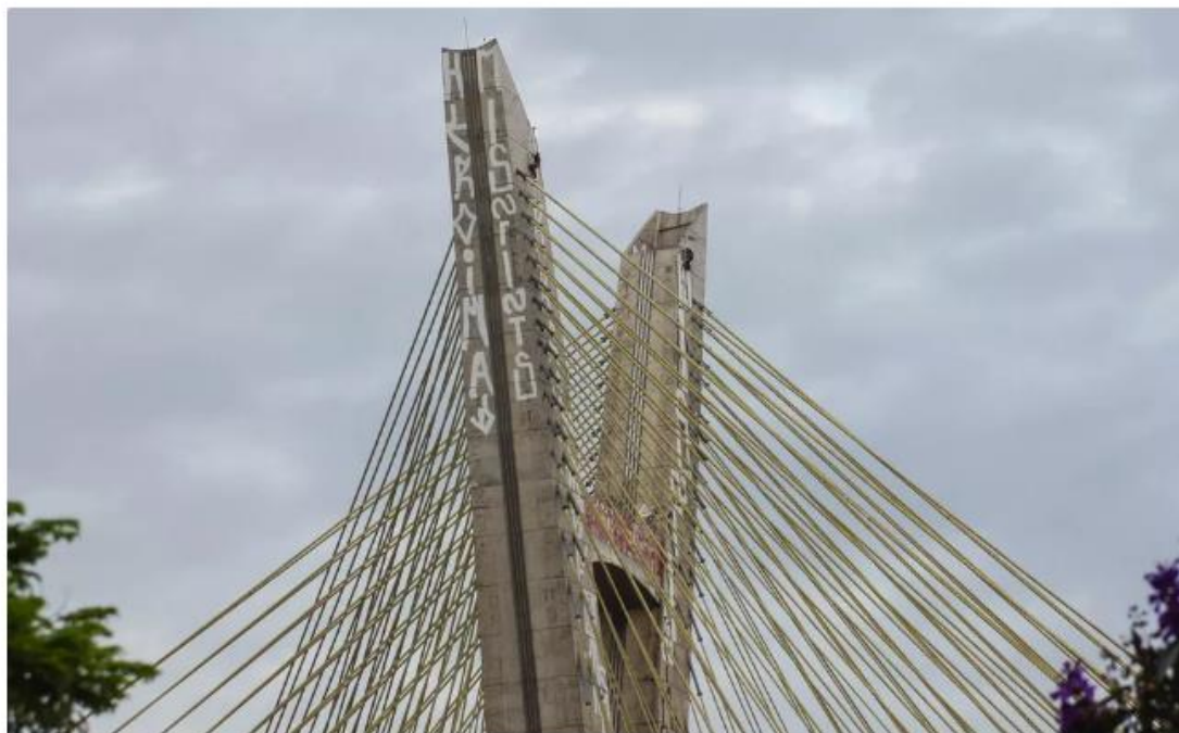
Equipe da Prefeitura de São Paulo dá início à remoção das pichações na Ponte Octavio Frias de Oliveira, mais conhecida como Ponte Estaiada, na Zona Sul da cidade

Doria também fez anúncios concretos. Disse que iria liberar o Viaduto Nove de Julho para carros compartilhados, o que aconteceu a partir do dia 6 . E também disse que o Corujão da Saúde iria começar neste dia 10. O início está previsto para a noite desta terça-feira (10).