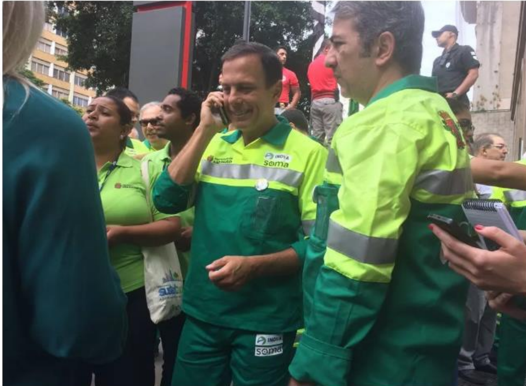
📍 Doria e secretários com uniformes da empresa de limpeza de SP

10/01/2017 20h40 · Atualizado há menos de 1 minuto