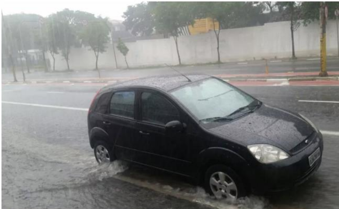
Chuva alaga ruas na Zona Norte da cidade

De acordo com previsão dos meteorologistas do CGE, nas próximas horas novas áreas devem se formar em outras regiões, com potencial para formação de alagamentos e rajadas de vento.