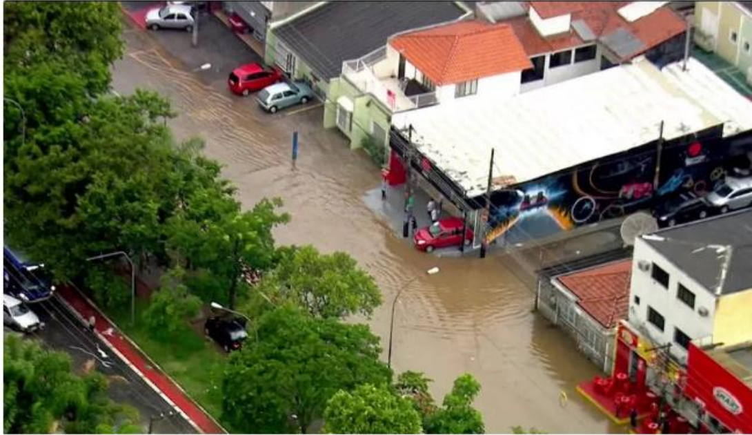
📍 Rua alagada na Zona Norte

O temporal provocou alagamento na estação Jardim São Paulo do Metrô, e prejudicou a circulação de trens da Linha - Azul, que opera com velocidade reduzida. A Linha - 5 Lilás também apresentou lentidão por conta da chuva na região.