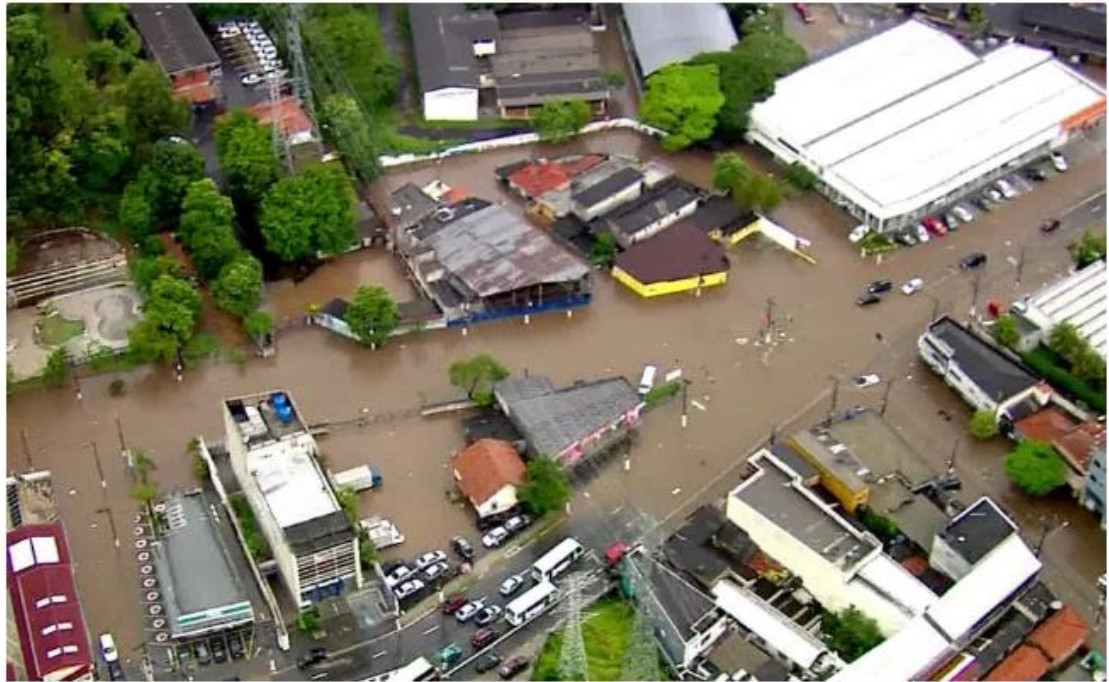
Alagamento na Zona Norte de SP