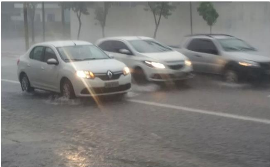
Chuva forte na Zona Norte de SP