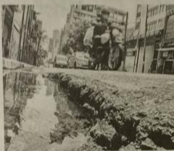
Água acumulada em buraco na rua Augusta; prefeitura diz que há mais equipes de manutenção

ladoria Cidade Linda. As consequências desse campo minado são a piora no trânsito, riscos de acidentes e avarias em peças do