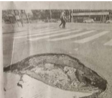
Buraco na esquina da rua Ana Cintra com a avenida São João, no centro; risco para carros e pedestres

A falta de manutenção causou crescimento de 39,8% nas quebras sobre a situação das ruas feitas à Du-