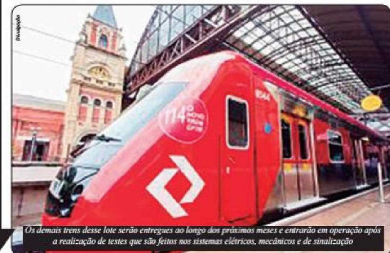
Os demais trens desse lote serão entregues ao longo dos próximos meses e entrarão em operação após a realização de testes que são feitos nos sistemas elétricos, mecânicos e de sinalização

"São, ao todo, 65 trens. Cada trem tem oito carros, então são 520 carros novos para a CPTM. Isso traz dois benefícios para a população: um benefício é a troca de trem antigo pelo trem novo e o outro é mais trem, mais horário, diminui a superlotação e oferece melhor conforto para o usuário", comentou Alckmin.