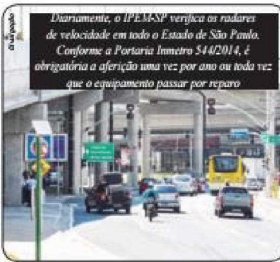
Diariamente, o IPEM-SP verifica os radares de velocidade em todo o Estado de São Paulo. Conforme a Portaria Interma S442014, é obrigatória a aferição uma vez por ano ou toda vez que o equipamento passar por reparo

A aferição no radar leva de 20 minutos até uma hora. A ação envolve os fiscais do IPEM-SP, uma equipe da empresa responsável pelo radar e agentes de trânsito. Para evitar acidentes, durante a aferição fica impossibilitada a passagem de pedestres e veículos na via. Em caso de excesso de velocidade, para aplicação de multas, o equipamento precisa estar verificado pelo IPEM-SP. Caso o equipamento seja aprovado, recebe um certificado válido por um ano. Quando há reprovação, a empresa fabricante é notificada a corrigir o erro.