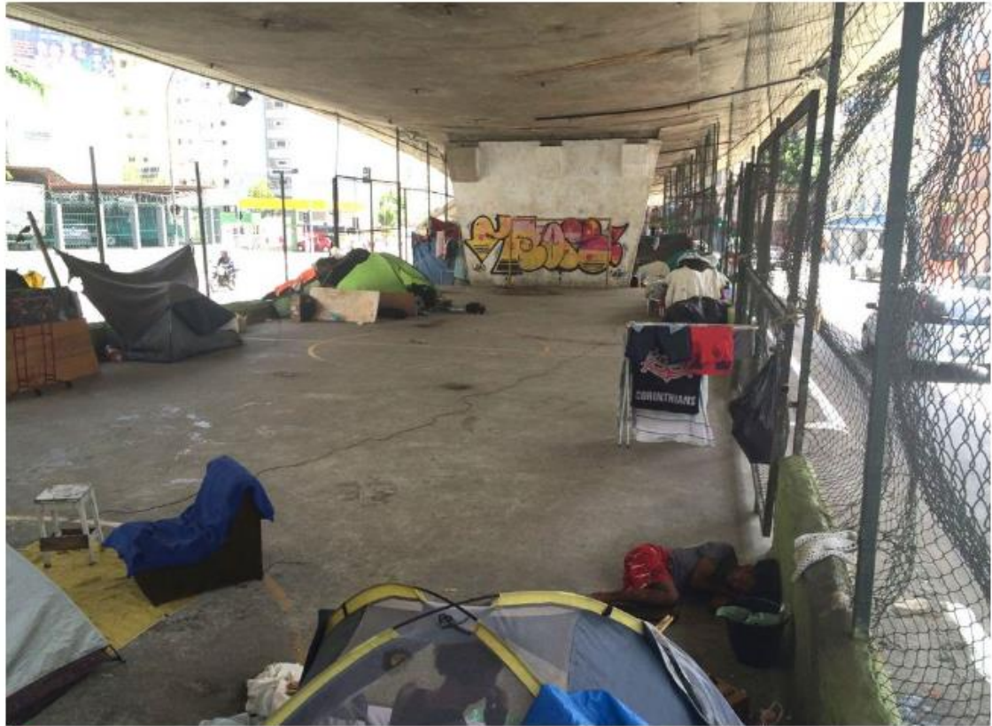
📍 Quadra de futebol agora abriga moradores de rua no Centro de São Paulo