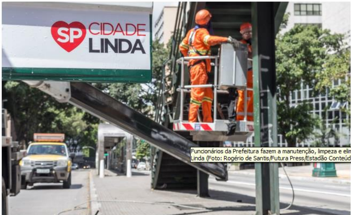
Funcionários da Prefeitura fazem a manutenção, limpeza e eliminação de pichações na Avenida Nove de Julho, no bairro da Bela Vista, parte da Operação Cidade Linda