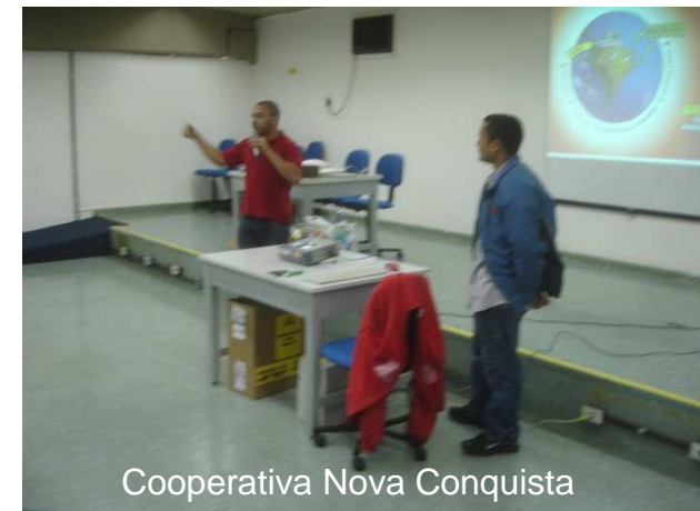
Cooperativa Nova Conquista