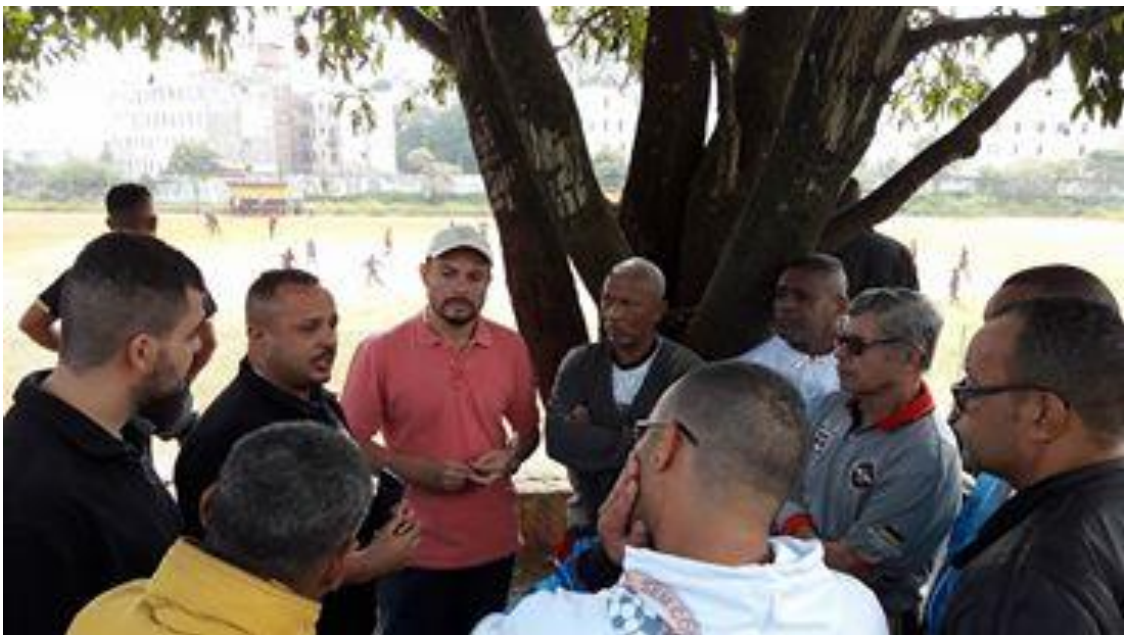
Festa da Primavera – Parque do Rodeio