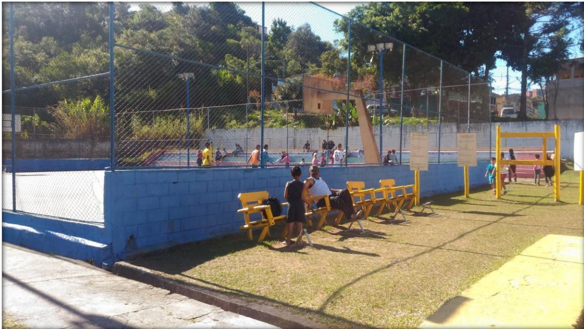
Semana das Crianças, diversão e alegria para as crianças com parceria dos empresários locais. Cerca de 600 participantes