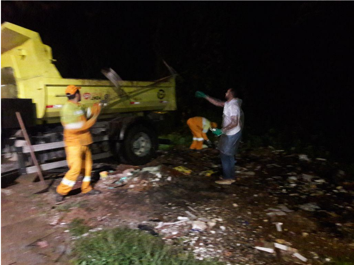
Inauguração quadra de Street Ball, parceria com a Secretaria Municipal de Esportes