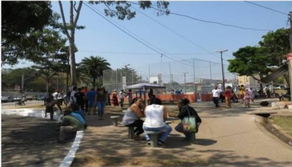
Verdejando em parceria com a rede Globo