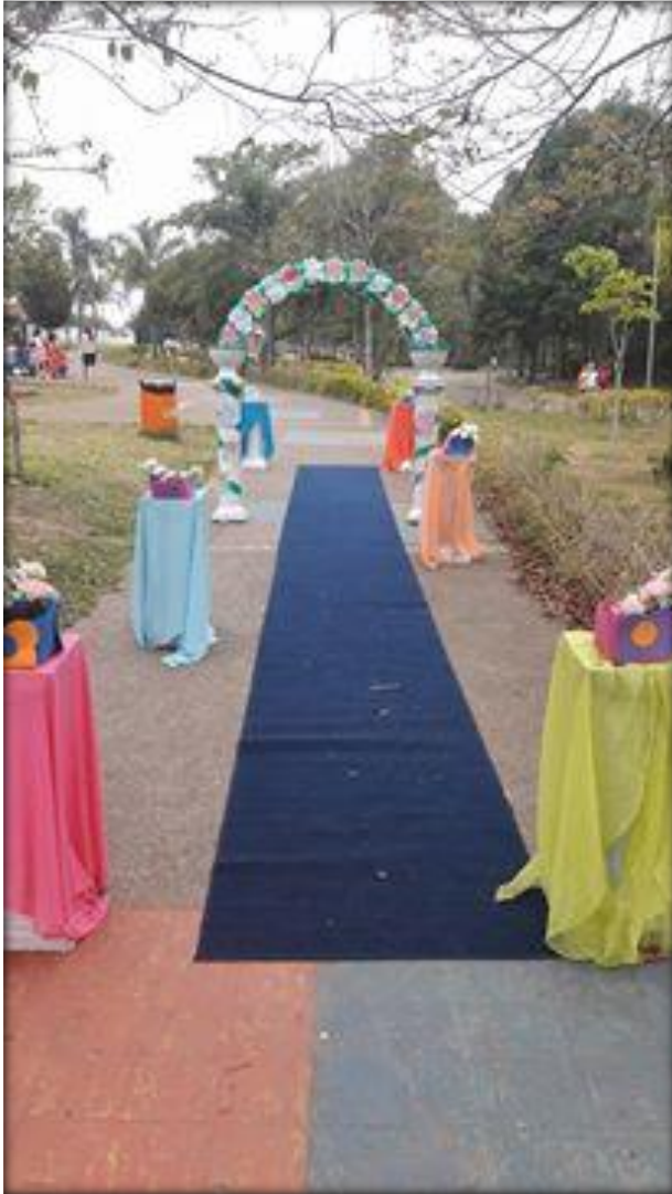
Primeira Copa de Ciclismo de Cidade Tiradentes