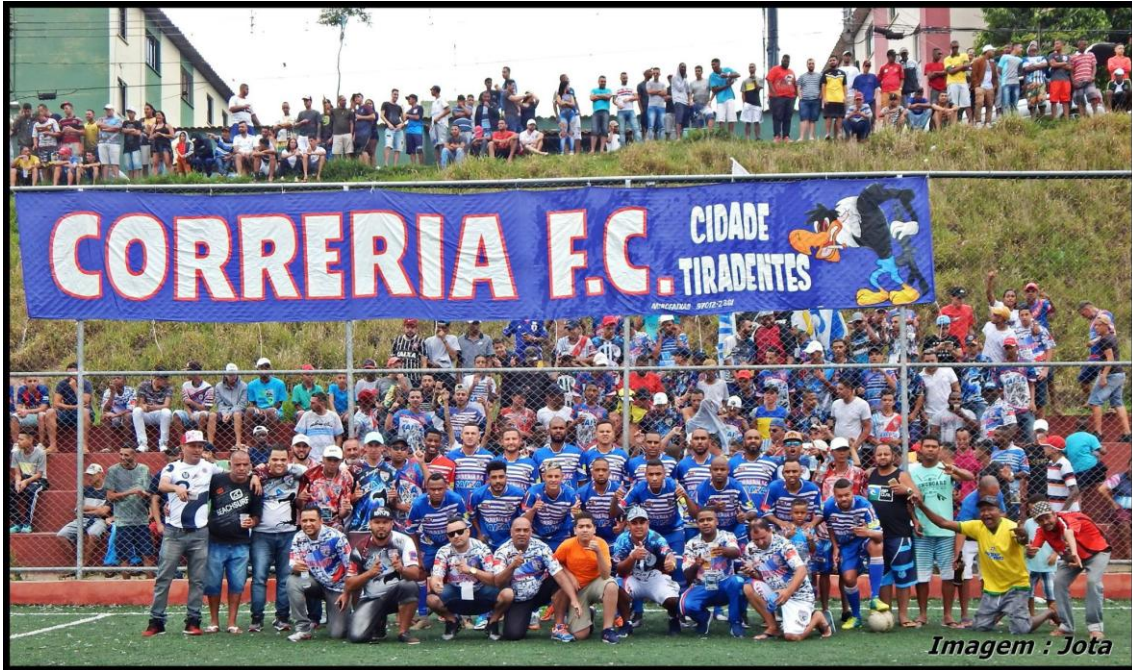
Primavera Empreendedora Cidade Tiradentes, 150 empreendedores participaram.