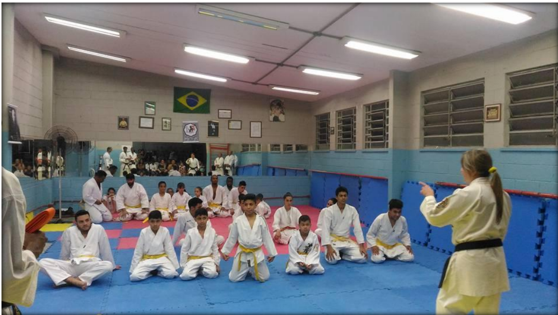
Audiência Pública – Ciclovia e Mobilidade Urbana