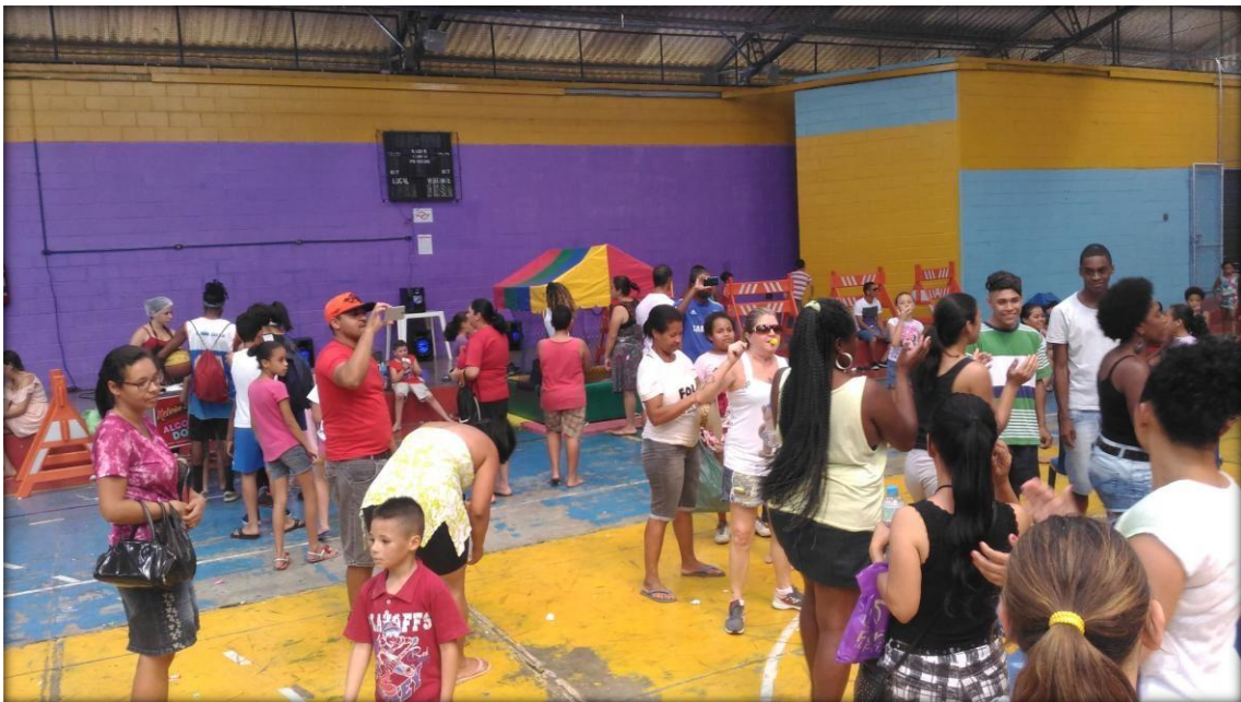
Reuniões com os Conselhos do Bairro