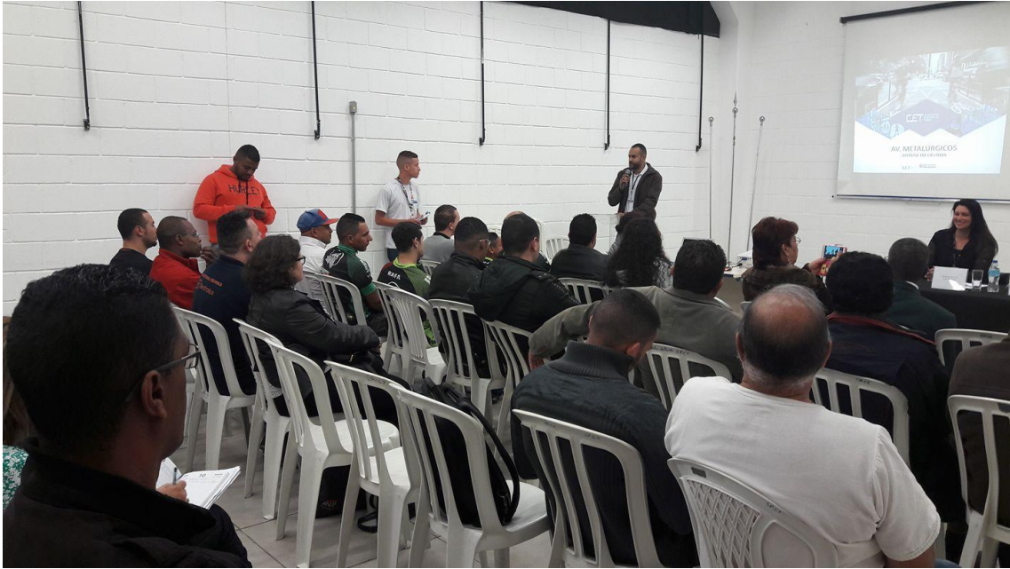
Projeto Ouvindo a Comunidade