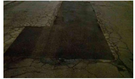
Rua Belarmino Belisário de Araújo, 105-157 - Jardim Itapurá (depois)