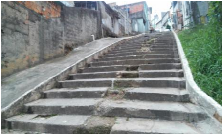
Limpeza no escadão da Rua Fidela Campina