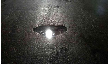
Rua Belarmino Belisário de Araújo, 105-157 - Jardim Itapurá (antes)