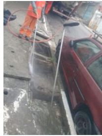
Limpeza e desobstrução de bueiros – Rua Arquiteto Felipe Joaquim Júnior