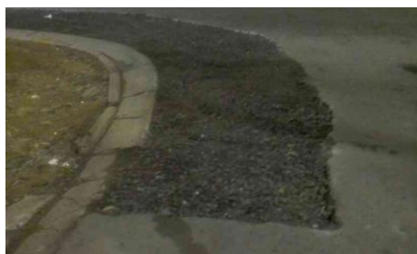
R. do Mar Paulista, 4 - Balneário Mar Paulista (durante)