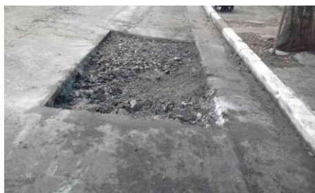
Av. Pedro de Avos, 536 - Jardim Miriam (durante)