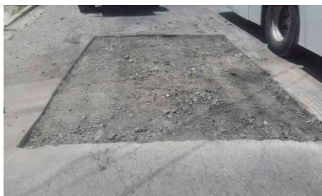
Av. Pedro de Avos, 177-205 - Jardim Miriam (durante)