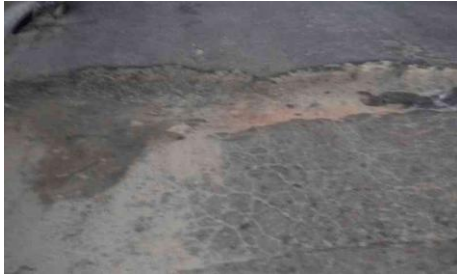
R. dos Robalos, 165-197 - Santa Amélia (antes)