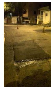
Av. Pedro de Avos, 536 - Jardim Miriam (depois)