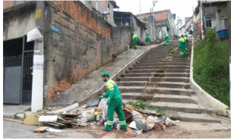
Limpeza no escadão da Rua Fidela Campina