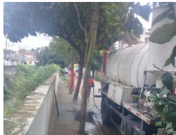
Limpeza e desobstrução de bueiros – Rua Catarina Cavalieri