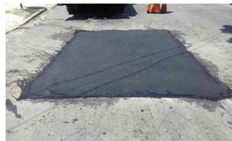
Av. Pedro de Avos, 177-205 - Jardim Miriam (depois)