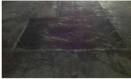
Rua Belarmino Belisário de Araújo, 105-157 - Jardim Itapurá (durante)