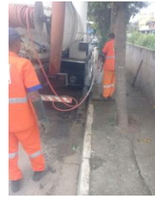
Limpeza e desobstrução de bueiros – Rua Arquiteto Felipe Joaquim Júnior