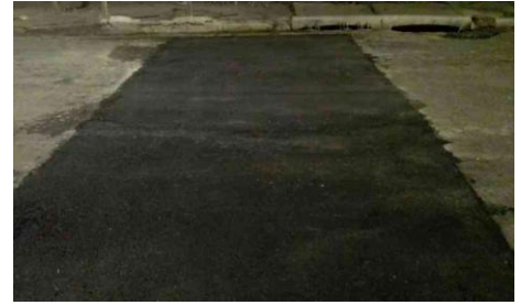
R. dos Robalos, 165-197 - Santa Amélia (depois)