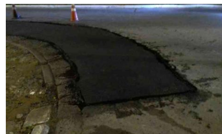
R. do Mar Paulista, 4 - Balneário Mar Paulista (depois)