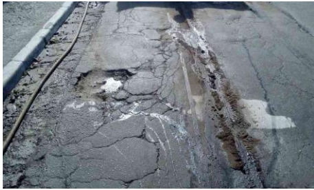
R. Zike Tuma, 940 - Jardim Ubirajara (antes)