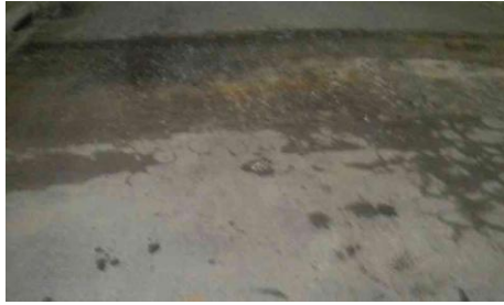
R. dos Robalos, 165-197 - Santa Amélia (durante)