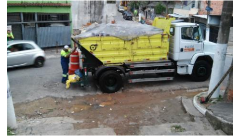
Limpeza no escadão da Rua Fidela Campina