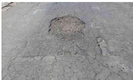
Av. Pedro de Avos, 177-205 - Jardim Miriam (antes)