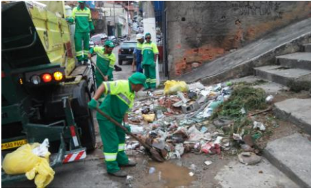
Limpeza no escadão da Rua Fidela Campina