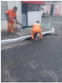
Limpeza e desobstrução de bueiros – Rua Arquiteto Felipe Joaquim Júnior