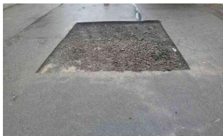
R. Comendador Ítalo Franceschi, 271 - Americanópolis (durante)