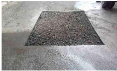
Rua Coronel Antonio Inojosa, 475-493 - Jardim Pedreira (durante)