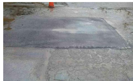
R. Comendador Ítalo Franceschi, 271 - Americanópolis (depois)