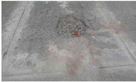
Rua Coronel Antonio Inojosa, 475-493 - Jardim Pedreira (antes)