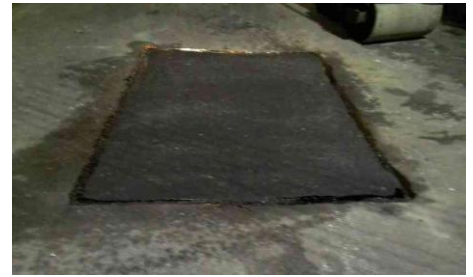
Rua Coronel Antonio Inojosa, 475-493 - Jardim Pedreira (depois)