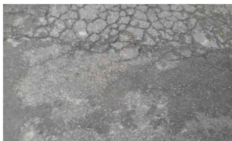
Av. Pedro de Avos, 536 - Jardim Miriam (antes)