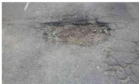
R. Comendador Ítalo Franceschi, 271 - Americanópolis (antes)